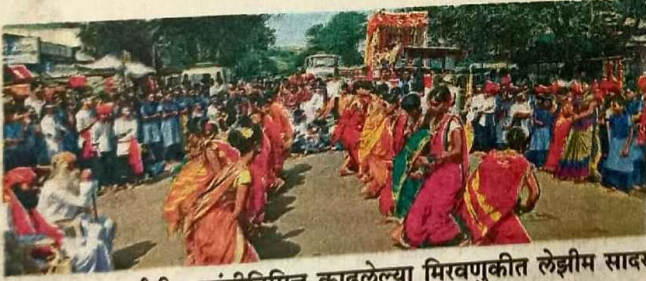
मलवडी : कर्मवीर जयंतीनिमित्त काढलेल्या मिरवणुकीत लेझीम सादर करताना विद्यार्थिनी.

या शोभायात्रेत झांज पथक, लेझीम पथक, गरबा नृत्य, टिपरी नृत्य सादर करण्यात आले, तसेच विविध महापुरुषांच्या वेशभूषा साकारण्यात आल्या होत्या. मलवडी येथे त्रिंबकराव काळे विद्यालयाने कर्मवीरांच्या प्रतिमेची मिरवणूक काढली. बस स्थानक परिसरात विद्यार्थ्यांनी विविध मनोरे साकारले, तसेच लेझीम व झांज पथकाचे उत्कृष्ट सादरीकरण केले.